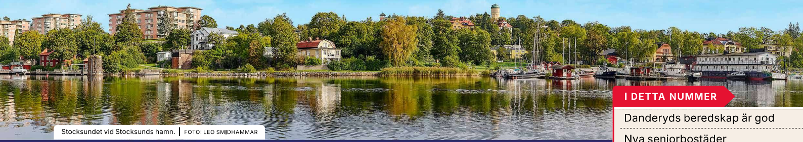
Stocksundet vid Stocksunds hamn.